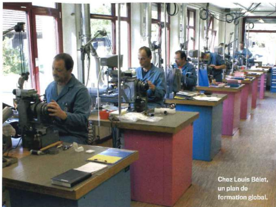
Chez Louis Bélet, un plan de formation global.