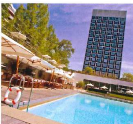
L'InterContinental Genève encourage la participation à des compétitions sportives.